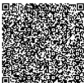
QR код № 1