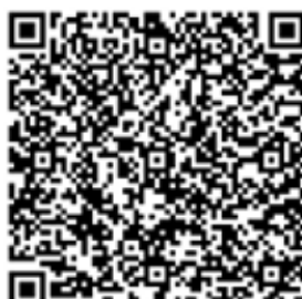
QR код № 2